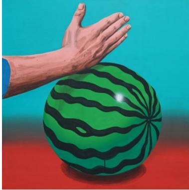
이우성 LEE Woosung